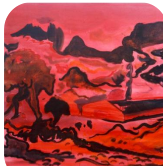
nder Title (Untitled), 1983 canvas